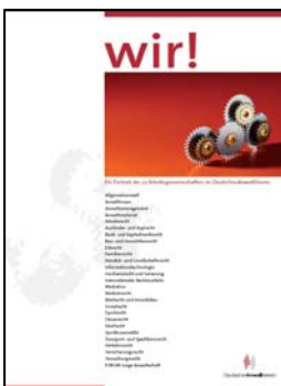
wir!-Broschüre der Arbeitsgemeinschaften