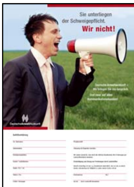
Flyer „Deutsche Anwaltauskunft“ Richtung Anwältinnen und Anwälte