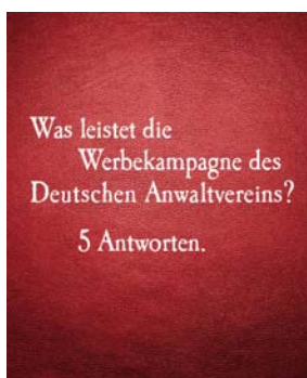
Broschüre zur DAV-Werbekampagne